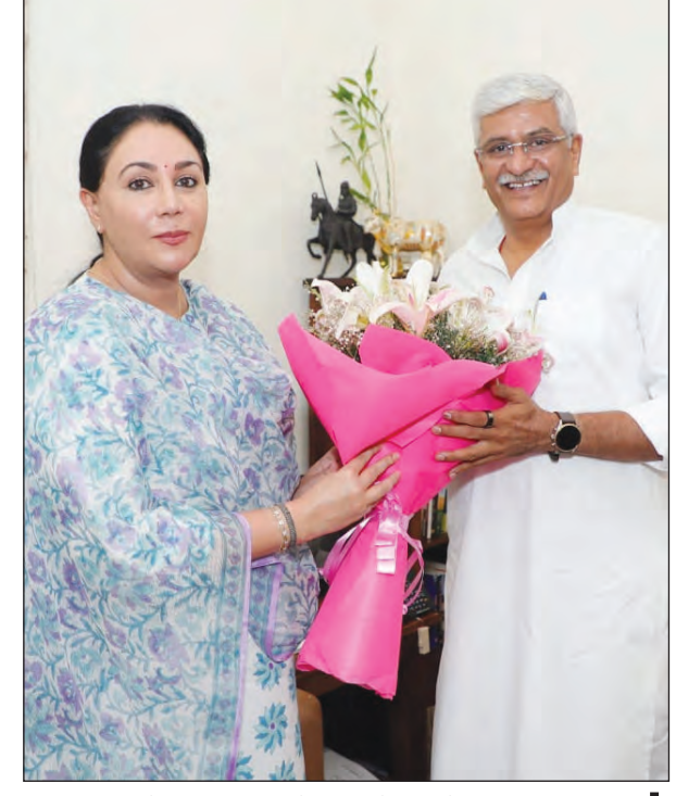
राजस्थान की उप-मुख्यमंत्री ने केंद्रीय मंत्री गजेंद्र सिंह शेखावत से की मुलाकात।

से सबसे ज्यादा पर्यटक उत्तर प्रदेश में आते हैं। इन सकारात्मक परिस्थितियों ने होटल इंडस्ट्री के लिए अपार संभावनाओं को जन्म दिया है। बड़ी संख्या में होटलों की आवश्यकता का अनुभव किया जा रहा है। होटल इंडस्ट्री को प्रोत्साहित करने के लिए हमें अपने बिल्डिंग बाइलॉज में परिवर्तन करने की आवश्यकता है। आवासीय क्षेत्र में 06 कमरों से 20 कमरों तक के होटल निर्माण के लिए न्यूनतम भूमि और होटल तक पहुंच मार्ग की चौड़ाई की न्यूनतम सीमा में बदलाव किया जाना चाहिए। साथ ही, पार्किंग, सिक्वोरिटी और फायर सेफ्टी जैसे अतिमहत्वपूर्ण विषयों में मानक का सख्ती से अनुपालन कराया जाए।